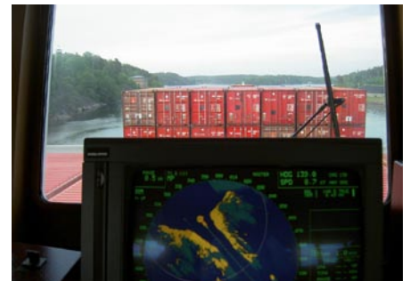
Skrymmande däckslast.