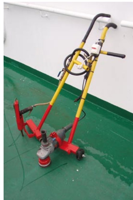
Vagnarna minskar belastning och vibrationer från både nålpistol och slipmaskin.