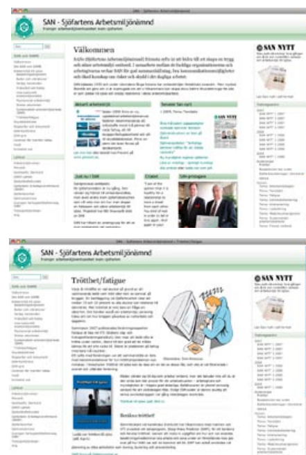
I menyn till vänster finns information om San, Sams och arbetsmiljö. Till höger arkivet med San-nytt.