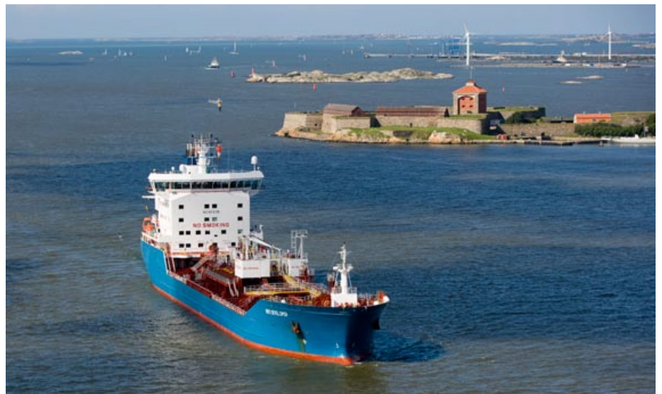
Bro Developer på väg in till Göteborg och rederikontoret.

Han tycker att relationerna inom Broström redan är bra men att de kan bli ännu bättre. Därför har man beslutat att bjuda in all nyanställd ombordpersonal