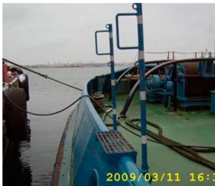
Den nya utformningen av räcket är, som synes, mycket lämpligare än den tidigare.