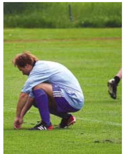
Tung förlust för "Silja Symphonys" besättning.