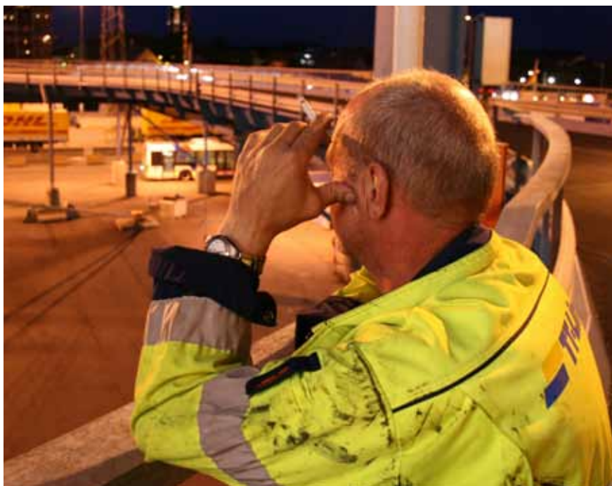
Vem som helst kan bli offer för mobbning på arbetsplatser, enligt arbetsmiljökonsulten. Mannen på bilden har ingenting med texten att göra.

Accepteras en rå jargong och sexuella skämt är det lättare att folk blir kränkta och mår dåligt än om man har en mer professionell hållning till varandra.