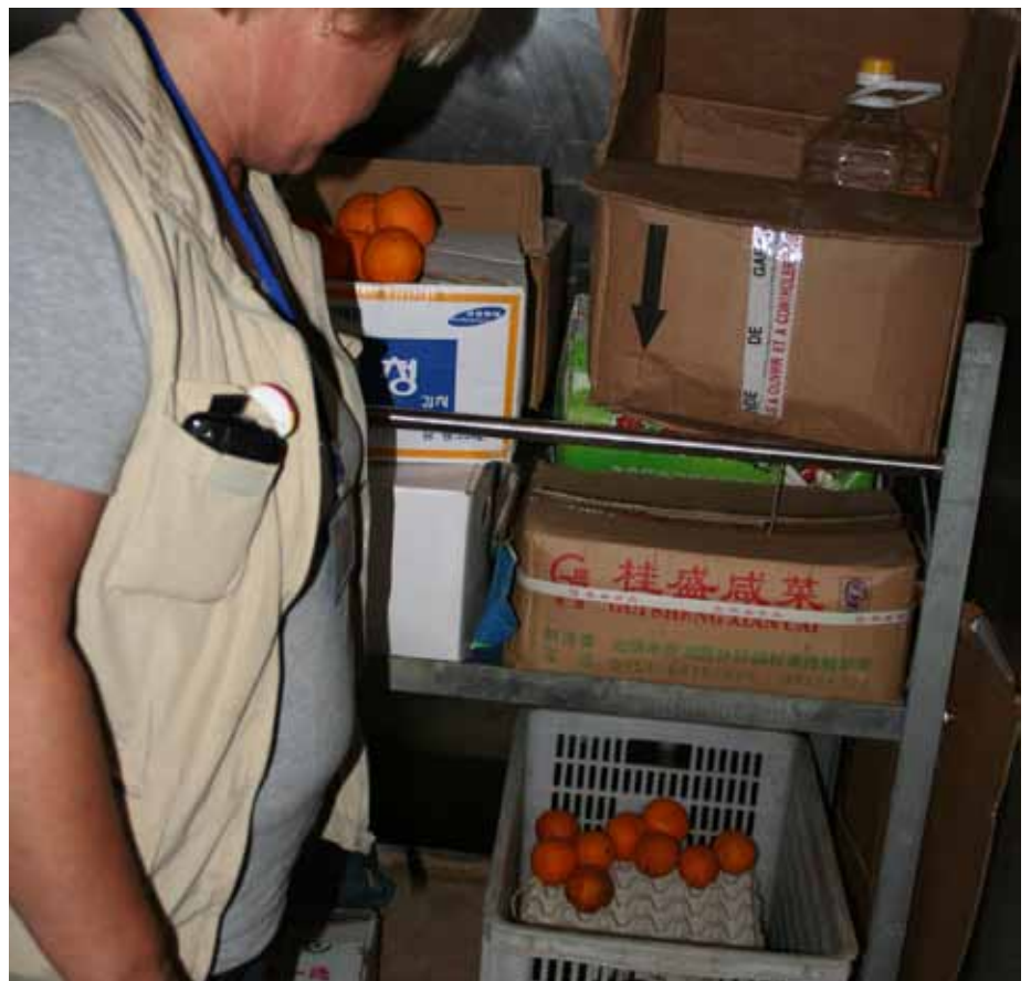
Sjöarbetskonventionen kräver att det finns tillräckligt med mat av god kvalitet ombord.

Sjöarbetskonventionen är en diger lunta som sammanfogar 37 befintliga konventioner och ungefär lika många rekommendationer. Löner, sjukersättning, avlösningssystem, sjukvård, hyttstorlekar, kosthållning och utformning av mässar är bara axplock av allt det som omfattas. Blågula fartyg uppfyller redan de flesta av konventionens krav, men en del förändringar blir det även här. Läkarintyg för sjöfolk ska förnyas vartannat