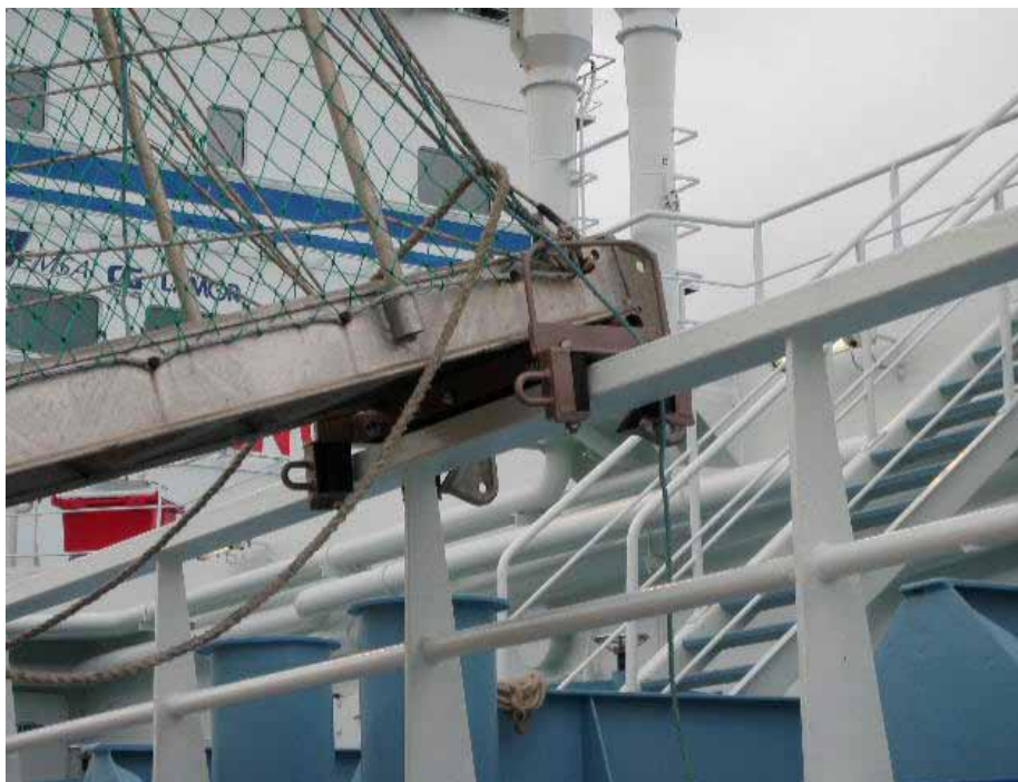
Två hjulförsedda landgångsvagnar underlättar arbetet på tankfartyget M/T Tellus.