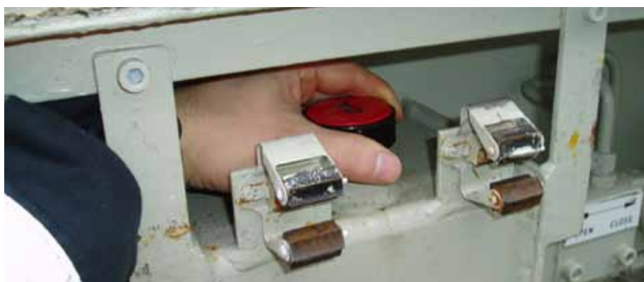
There are plenty of examples of less than successful designs on ships.

"Start with the crew and go through their tasks. On that basis, plan the layout of equipment and the design of rooms. This is not rocket science, it is basic ergonomics, but you have to get that way of thinking involved early in the process.