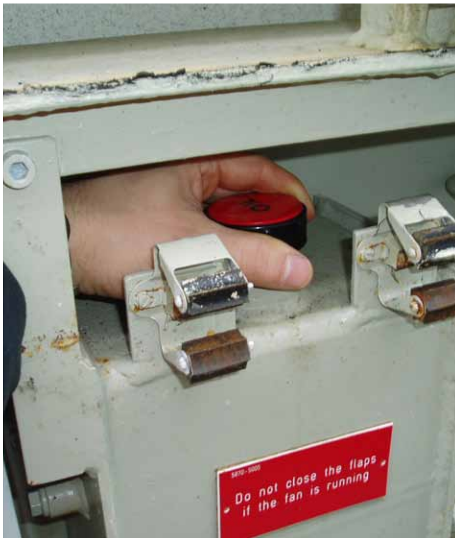
Ombord finns det gott om exempel på mindre lyckade designlösningar.

Och att konkurrensen om utrymmet ombord ofta är hård är ingen ursäkt för dålig design, säger hon.