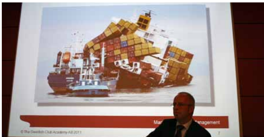
Dyra misstag. Containerfartyget Rena grundstötte utanför Nya Zeeland i oktober.

Idag finns stora insikter om risker i arbetsmiljön ombord, men man är sämre på att omsätta det kunskandet i faktiska förbättringsåtgärder. Det var en av slutsatserna på höstens San-konferens.