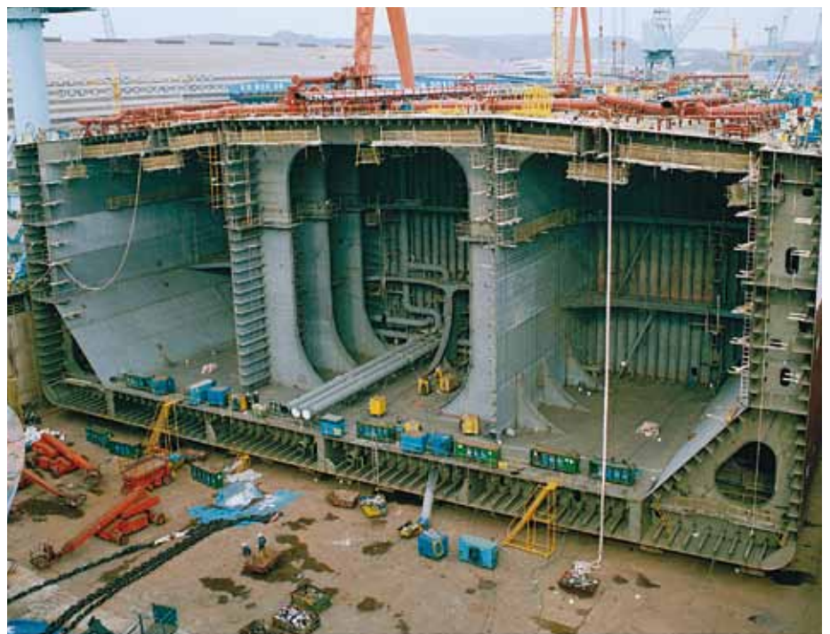
Brister som byggs in på varvet är ofta dyra och omständiga att ändra i efterhand.